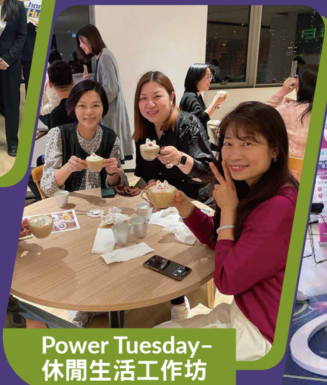
Power Tuesday- 休閒生活工作坊