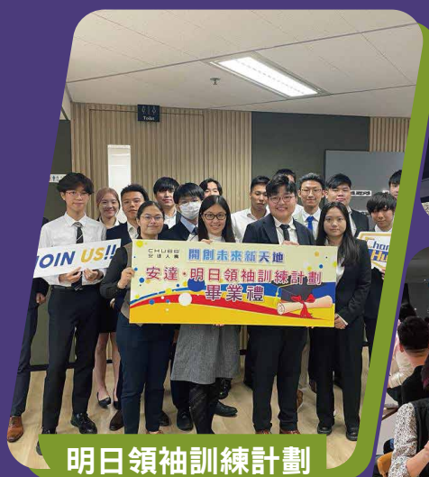
明日領袖訓練計劃